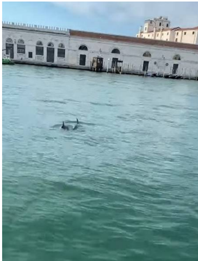
Figura 1 – Golfinhos nos canais de Veneza durante o lockdown.

Fonte: https://extra.globo.com/noticias/page-not-found/lockdown-em-veneza-leva-ate-golfinhos-para-canais-da-cidade-italiana-24938816.html .