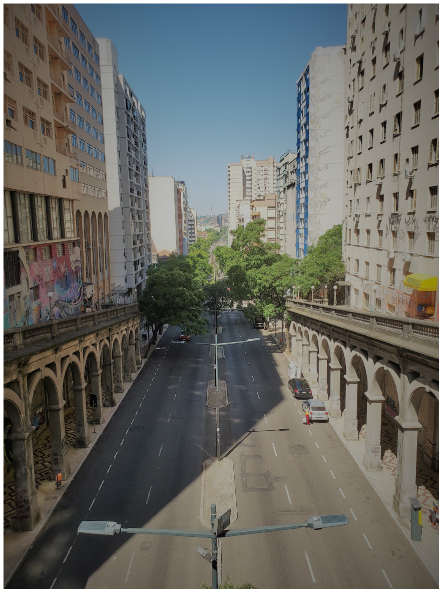
Figura 2 – Avenida Borges de Medeiros, Porto Alegre, RS. 20 de março 2021.

Neste contexto, as paisagens urbanas foram completamente alteradas, devido às restrições à circulação de carros, de ônibus e de pessoas. Observemos a figura 2, que retrata a Avenida Borges de Medeiros, em uma manhã de sábado, no mês de março de 2021. A via estava “vazia”, como se tivesse sido acometida pela bomba H, mencionada por Milton Santos, cuja referência fizemos anteriormente. Essa imagem em nada se parece com a Porto Alegre, capital dos gaúchos, presente nos versos Kleiton e Kledir e outros compositores populares.