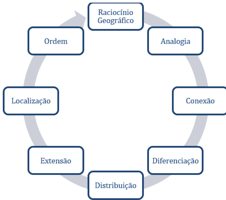
Figura 3 – Fluxograma Raciocínio Geográfico. Org: RODRIGUES, Aline